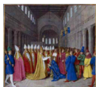
Charles Ier ou Carolus Magnus "Charlemagne" de HERSTAL

2660182807472) Charles Ier ou Carolus Magnus "Charlemagne" de HERSTAL , Couronné Empereur en 800, comte en Istrie, roi des Francs (768-814), empereur d'Occident (800-814), roi des Lombards (774), fils de Pépin III (714-768) et Bertrade de LAON (726-783), né à Jupille [Marcourt] (Luxembourg) le 2 avril 747, reçu au baptême à Saint-Denis (Seine-Saint-Denis) le même jour, décédé à Aix-la-Chapelle [Aachen] (Köln) le 28 janvier 814, inhumé dans la même localité.