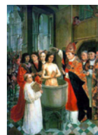
Clovis Ier ou Clodovech ou Hlodovic MÉROVINGIENS

1362013597436512) Clovis Ier ou Clodovech ou Hlodovic MÉROVINGIENS , en vieux francique, "Hlod-Wig" s'illustre à la guerre (en germano-latin Hludovicus) est un doublet de "Louis", roi des Francs Saliens (481-511), fils de Childéric Ier (~ 436-< 481 & 482) et Basine von THÜRINGEN (~ 445-491), né à Tournai [Doomik] (Hainaut) en 466, reçu au baptême à Reims (Marne) le 25 décembre 498, décédé à Paris (Paris) le 27 novembre 511. Il s'est marié entre 486 et 493 avec Amalaberge HÉRULE , Marié (1) 281 , fille d'Odoacre Ier (°~ 435), Il prit Rome le 23 août 476., roi des Hérules (peuplade de mercenaires venus de Poméranie) puis d'Italie et Evochilde WISIGOTHS (°~ 446), née vers 462, décédée vers 510.