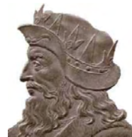
Chlodion DES FRANCS

5448054389752681) Lucilla de NARBONNE , fille de Tonantius Ferreolus (462-517) et Industrie de NARBONNE, née vers 485, décédée en 526.