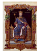
Clotaire Ier ou Chlothachar MÉROVINGIENS

340503399362753) Yrsa Helgesdatter N. , née vers 580.