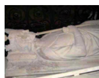
Pépin III CAROLINGIENS

5320365614944) Pépin III CAROLINGIENS , Maire de Palais (741-751), roi des Francs et Ier des Carolingiens (Pépin Ier, 751-768), duc de Neustrie et de Bourgogne (741), duc d'Austrasie (Pépin III, 747), fils de Charles Martel (676-741) et Rotrude ou Chrotrude de TRÈVES [VON TRIER] (~ 695-724), né à Jupille [Marcourt] (Luxembourg) en 714, décédé à Basilique Royale de Saint-Denis (Seine-Saint-Denis) le 24 septembre 768, inhumé dans la même localité.