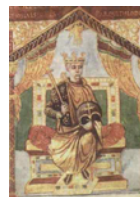
Charles II ou Ier CAROLINGIENS

665045701868) Charles II ou Ier CAROLINGIENS , comte de Souabe et de Thurgau, roi des Francs (20 juin 840 - 6 octobre 877), roi d'Aquitaine (848-855), roi de Lotharingie (Charles Ier, 869-870), empereur d'Occident (875-877), roi d'Italie (876-877), fils de Louis Ier (778-840) et Judith [Luditha ou Yutha ou Judith] de BAVIÈRE [VON BAYERN] (805-843), né à Francfort-sur-le-Main [Frankfurt am Main] (Frankfurt am Main) le 13 juin 823, décédé à Avrioux (Savoie) le 6 octobre 877, inhumé à Nantua (Ain) après le 6 octobre 877, inhumé à Basilique Royale de Saint-Denis (Seine-Saint-Denis) en 884.