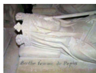
Bertrade de LAON

5320365614945) Bertrade de LAON , seul un de ses pieds était plus grand que l'autre., fille de Caribert II (< 696-> 747) et Gisèle d'AQUITAINE (°~ 690), née à Laon (Aisne) en 726, décédée à Choisy-au-Bac (Oise) le 24 juillet 783.