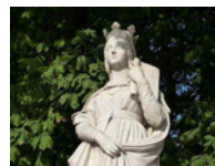
Bathilde ou Bathildis, Baldechildis d'ASCAGNIE

Il s'est marié en 651 avec Bathilde ou Bathildis, Baldechildis d'ASCAGNIE 262 (~ 626-680).