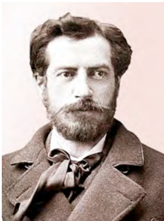
Fig. 1. Portrait d'Auguste Bartholdi

À cette époque, la région de Francfort, en Hesse du Sud, était luthérienne, alors que celle de Kassel (Hesse du Nord) était réformée d'obédience zwingliane. Or, Horinghausen se situait à la limite de ces deux régions. Le changement de seigneurie de ce village entraîna le passage à la religion réformée avec le renvoi du pasteur luthérien. Romane-Musculus (1979) indique qu'il a été suspendu en 1683 pour avoir négligé de publier les bans pour le mariage de sa fille.