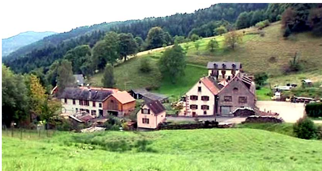
Fig. 3. La Grande Verrerie ( Vordere Glashütte ) de Ribeauvillé, photo récente (voir aussi Fig. 4, 5).

Vers 1674, Urs Mathis part pour s'installer près de Ribeauvillé, devenant un des fondateurs d'une nouvelle verrerie nommée Vordere Glashütte (Grande Verrerie) et élire domicile dans le hameau qui s'édifiait autour (Fig. 3-5).