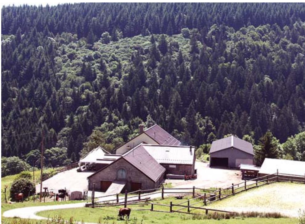
Fig. 2. Ferme-auberge Glashütte , sise sur le ban de Soultz, sur le versant Est du Grand-Ballon ; à cet endroit, il y avait l'ancienne verrerie de 1650 à 1713 - © photo publiée avec l'aimable autorisation de Pierre Brunner.

En se basant sur les actes paroissiaux des baptêmes des enfants, les lieux des paroisses catholiques sont de 1655-1656 : Soultz à la Glashütte ; de 1663-1669 : Ligsdorf, à la verrerie du Glasberg ; vers 1673 : Ribeauvillé à la Grande Verrerie, et permettent de suivre leurs lieux de travail et domiciles (Table 1, 2).