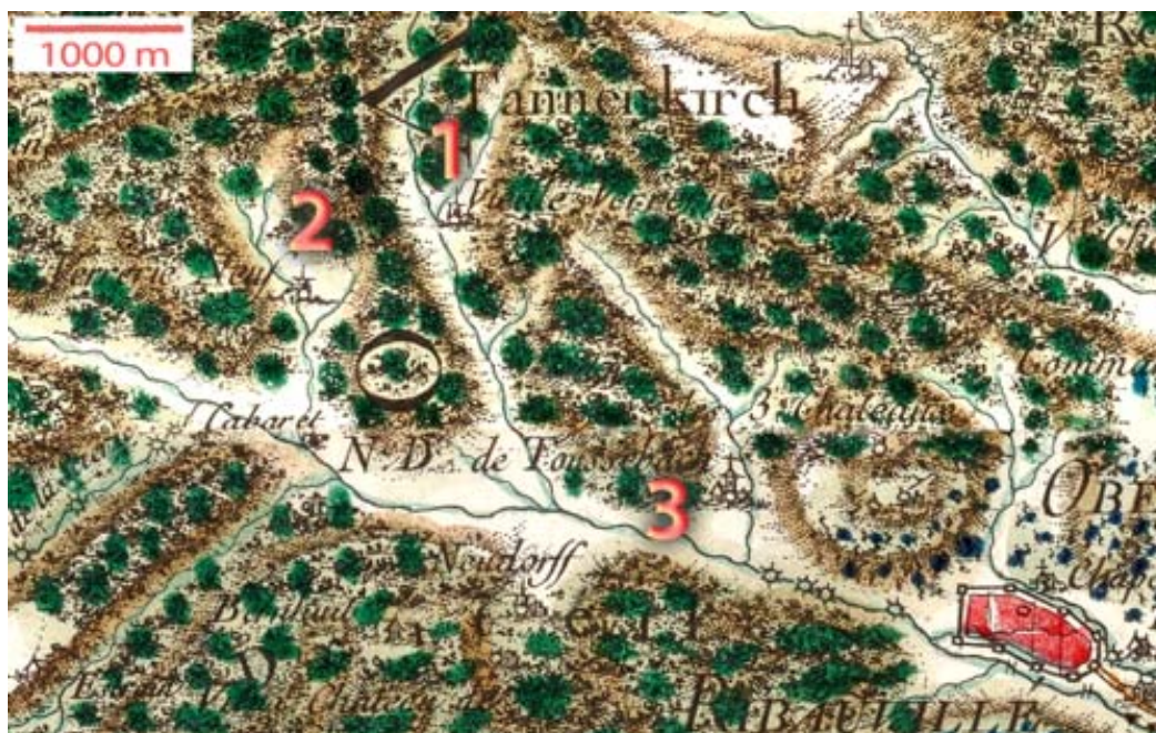
Fig. 4. Carte Cassini (XVIII e siècle) avec la localisation de la Vordere Glashütte (ici 1 sous Vieille Verrière), de la Hintere Glashütte (ici 2 sous Verrerie Neuf). 3 : le sanctuaire de Dusenbach. Et à droite la ville de Ribeauvillé ( Rappoltsweiler ou, en alsacien Ràppschwihr ).

Auparavant, des verriers sont mentionnés dès 1667 dans les registres paroissiaux de Ribeauvillé, dont Zacharias Graner (1644-1710), né à Sankt Blasien (Fig. 1 ; Table 3), puis Johannes Andres (1644-1677) devient en 1668 un maître verrier, puis en 1670 Giovanni Battista Cingano, un italien venu de Rimbach, et son frère. Il semblerait que les premières installations aient été sises près de l'ancien prieuré d'Eberlinsmatt (tout le site a disparu), pour lesquelles Johann Jacob, comte de Rappolstein (1598-1673), donna une autorisation d'exploiter une partie des forêts voisines. Cette première exploitation fut interrompue en 1674 et un nouveau site fut installé à la Vordere Glashütte (Fig. 3).