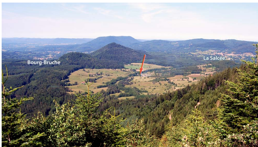
Fig. 6. La clairière du Hang vue depuis le Sud, d'un versant du Climont (Weinberg), le Hang est localisé par la flèche