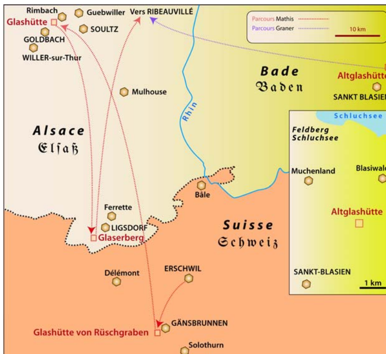
Fig. 1. Principales étapes de deux familles de verriers Urs Mathis et Zacharias Graner entre leurs lieux de naissance et Ribeauvillé (XVII e -XVIII e siècle).

En se basant sur les actes paroissiaux des baptêmes des enfants, les lieux des paroisses catholiques sont de 1655-1656 : Soultz à la Glashütte ; de 1663-1669 : Ligsdorf, à la verrerie du Glasberg ; vers 1673 : Ribeauvillé à la Grande Verrerie, et permettent de suivre leurs lieux de travail et domiciles (Table 1, 2).