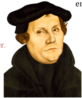
Fig. 6. Martin Luther en 1528, d'après un portrait de Lucas Cranach den Älterer.