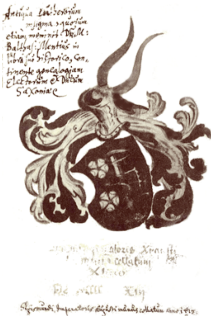
Fig. 1. Feuille dans Acta Lutherorum avec les armoiries de Luther datées de 1413 par l'empereur Sigismund von Luxemburg (1368-1437).