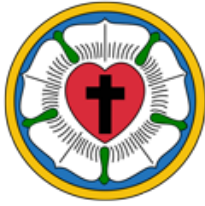
Fig. 5. Rose de Luther : symbole des églises évangéliques luthériennes - voir explication Tableau 1.

ther décrit sa rose comme un symbole de sa théologie. C'est une modification des armoiries familiales pour avoir un blason à valeur symbolique plus chrétienne. La diffusion de ce symbole date d'après 1530, contrairement à ce qui est souvent décrit ; aucun document mentionnant une adoption officielle à l'époque, ni plus tard, n'a pu être trouvé.