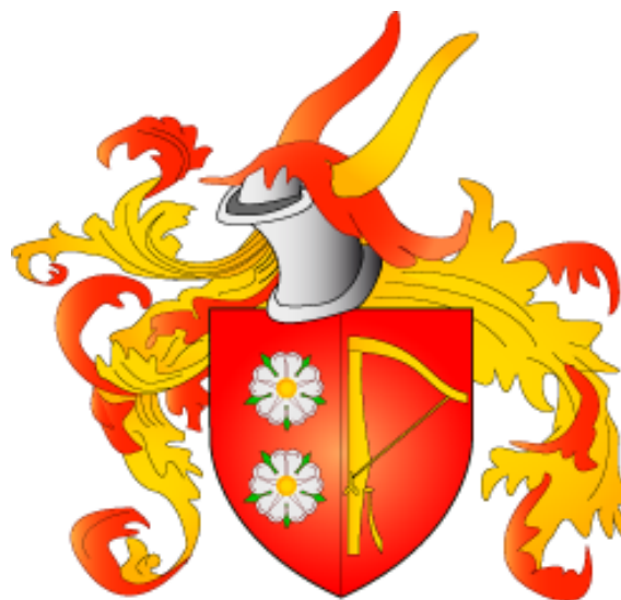
Fig. 2. Armoiries Luther redessinées avec les couleurs selon le blasonnement décrit (dessin original) – voir Fig. 3.

Son surnom de « Constant » ou d'« Obstiné » souligne sa volonté de poursuivre la politique de son défunt frère qui avait favorisé le développement de la Réforme protestante. En effet en 1527, la confession luthérienne devient Église d'Etat dans ses possessions en Saxe. En tant que souverain de Martin Luther, le prince Johann a entretenu une relation très étroite, presque amicale avec le principal théologien protestant.