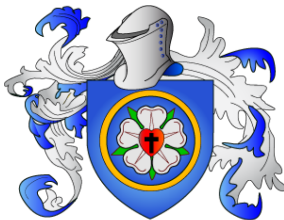
Fig. 4. Extrait de la p. 38 et de la Pl. 50 de Siebmacher (1857), avec blasonnement des armoiries (voir aussi Rietstap, 1887). Armoiries et blason (écu) du réformateur Martin Luther (original) - voir Fig. 3 et explications sur le Tableau 1.

Ces armoiries du réformateur sont représentées par Siebmacher (1857) et décrites par Rietstap (1887) (Fig. 3, 4) ; elles blasonnent : d'azur un cercle d'or contenant une rose d'argent, en son centre un cœur de gueules couvert d'une croix de sable. Casque Stechhelm (de la bourgeoisie) et lambrequins d'azur et d'argent.