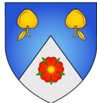
Fig. 3. Les armoiries a-c sont celles des fils de Martin Luther, selon les mentions de Siebmacher (1888 - voir extrait en fac-similé ci-contre) et de Hildebrandt (1876). Les armoiries anciennes (en d) sont représentées et blasonnées par Siebmacher (1888). L'écu des armoiries en e a été redessiné (ci-dessous) selon les mentions de Rietstap (1887) et Siebmacher (1888); comme le mentionne Rietstap (1887, p. 114), il s'agit de celles d'un grand-oncle de Martin.

Ci-contre : l'extrait en fac-similé de la p. 114 de l'Armorial général de Rietstap (1887).